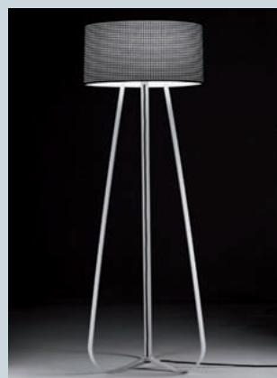
Visto in questo progetto Mannequin by Martini Light Design: CaberlonCaroppi Hotel & Design

La versatilità della collezione Mannequin è data dalla combinazione tra finiture preziose della struttura e le infinite possibilità di abbinamento del paralume che può essere rivestito in base alle esigenze d'arredo. L'essenza di questa lampada, disponibile nella versione da terra o da tavolo, è nella semplicità della struttura in cui il cavo di alimentazione diventa esso stesso elemento decorativo.